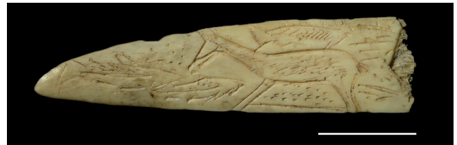
FIG. 3. — Doe and salmon engraved on bone, Bourouilla Cave, Arancou, Pyrénées Atlantiques. Photo credit: Frédéric Plassard (Base Jean-Clottes). Les représentations animales de la Préhistoire . https://animal-representation.cnrs.fr/s/bjc-en/item/15354 , last consultation on 14 April 2026). Scale bar: 1 cm. / Biche gravée sur un fragment d'os. Grotte de Bourouilla, Arancou, Pyrénées-Atlantiques. Crédit photo: Frédéric Plassard (Base Jean-Clottes). Les représentations animales de la Préhistoire . https://animal-representation.cnrs.fr/s/bjc-en/item/15354 , dernière consultation le 14 avril 2026). Barre d'échelle: 1 cm.

The practice of deer hunting and the utilization of its products, especially antlers, persists during the Neolithic period, even as the consumption of domesticated species increases (Stordeur 1985; Manca 2013). Laura Manca and Marjan Mashkour provide a comprehensive inventory of artifacts from three sites located in the Zagros and Alborz regions in Iran, along with a techno-functional analysis (Manca & Mashkour 2026). Their research indicates that the significance of deer diminished with the advent of the Neolithic period. This trend does not imply a total disappearance, but rather a transformation of technical systems associated with the incorporation of domesticated animals. Consequently, the role of deer transitions from a primary resource to a secondary one, while still retaining some of