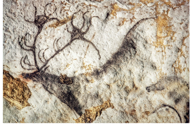
FIG. 2. — Le Cerf noir , Chinese Horse Panel, right wall, Axial Diverticulum, Lascaux cave. Le cerf noir. Panneau des « chevaux chinois », pari droite du diverticule axial. Grotte de Lascaux.

materials like antlers, canines, skin, and tendons, which are utilized to create tools, weaponry, and ornaments (Tejero et al. 2012; Averbough 2018; Peschaux 2019). This species was also prominently represented in both cave paintings (Fig. 2) and portable art (Fig. 3) (Leroi-Gourhan 1965; Aujoulat 2004; Averbough & Feruglio 2016). These depictions emphasize the significance of the deer, extending beyond the tangible realm, as a foundational element within symbolic frameworks, exhibiting notable differences based on the context. Georges Sauvet's paper illustrates that the variations in the portrayal of the doe in Paleolithic art are quite meaningful: they signify deep alterations in social networks and value systems (Sauvet 2025). The transition from a bestiary focused on the doe to one led by the bison aligns with changes in cultural exchanges among human communities.