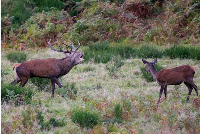
FIG. 1. — Red deer ( Cervus elaphus Linnaeus, 1758). Stag and doe at bellowing time in the middle of a meadow, Le Bosc, Ariège (France). Cerf élaphe ( Cervus elaphus Linnaeus, 1758). Cerf et biche au moment du brame dans une prairie. Le Bosc, Ariège (France).