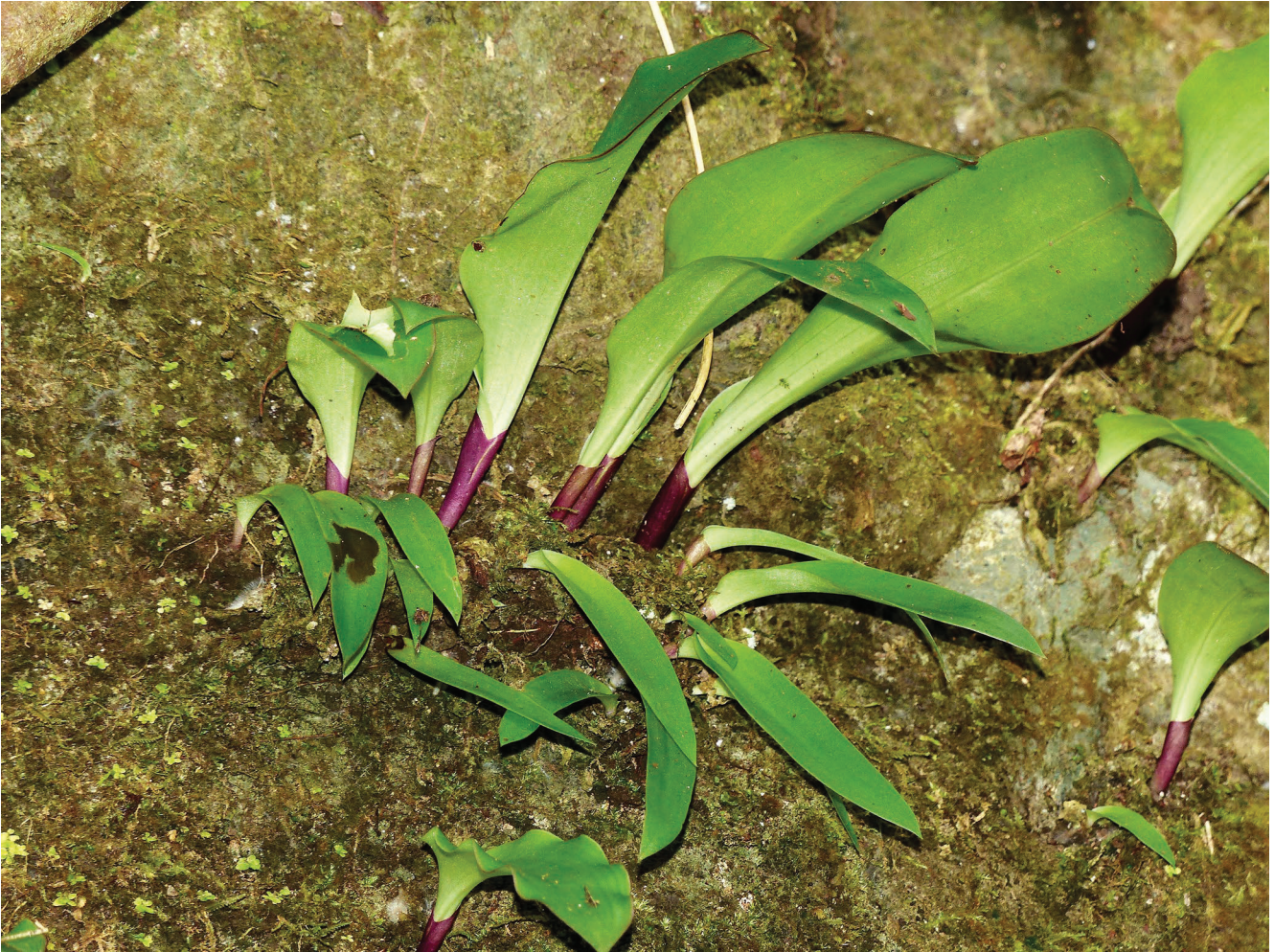
FIG. 4. — Cynorkis benaraensis Vennetier, Traclet & Dimassi, sp. nov., feuilles, 13.XII.2017, crédits photo : E. Vennetier.

dimensions, sa fleur à périanthe blanchâtre glanduleux-hispide, son labelle quadrilobé rose possédant en son centre une macule foncée, un lobe médian du rostellum large et tronqué. Elle cohabite dans certains secteurs du Mont Bénara avec C. purpurascens , C. fastigiata et une autre espèce de Cynorkis non identifiée à fleurs blanches. Toutefois, elle est la seule espèce du genre Cynorkis Thouars fleurissant à Mayotte durant la période de mi-juin à mi-septembre, alors que C. purpurascens fleurit de fin novembre à début janvier, C. fastigiata d'octobre à février et le Cynorkis non identifié à fleurs blanches, de mi-novembre à mi-décembre.