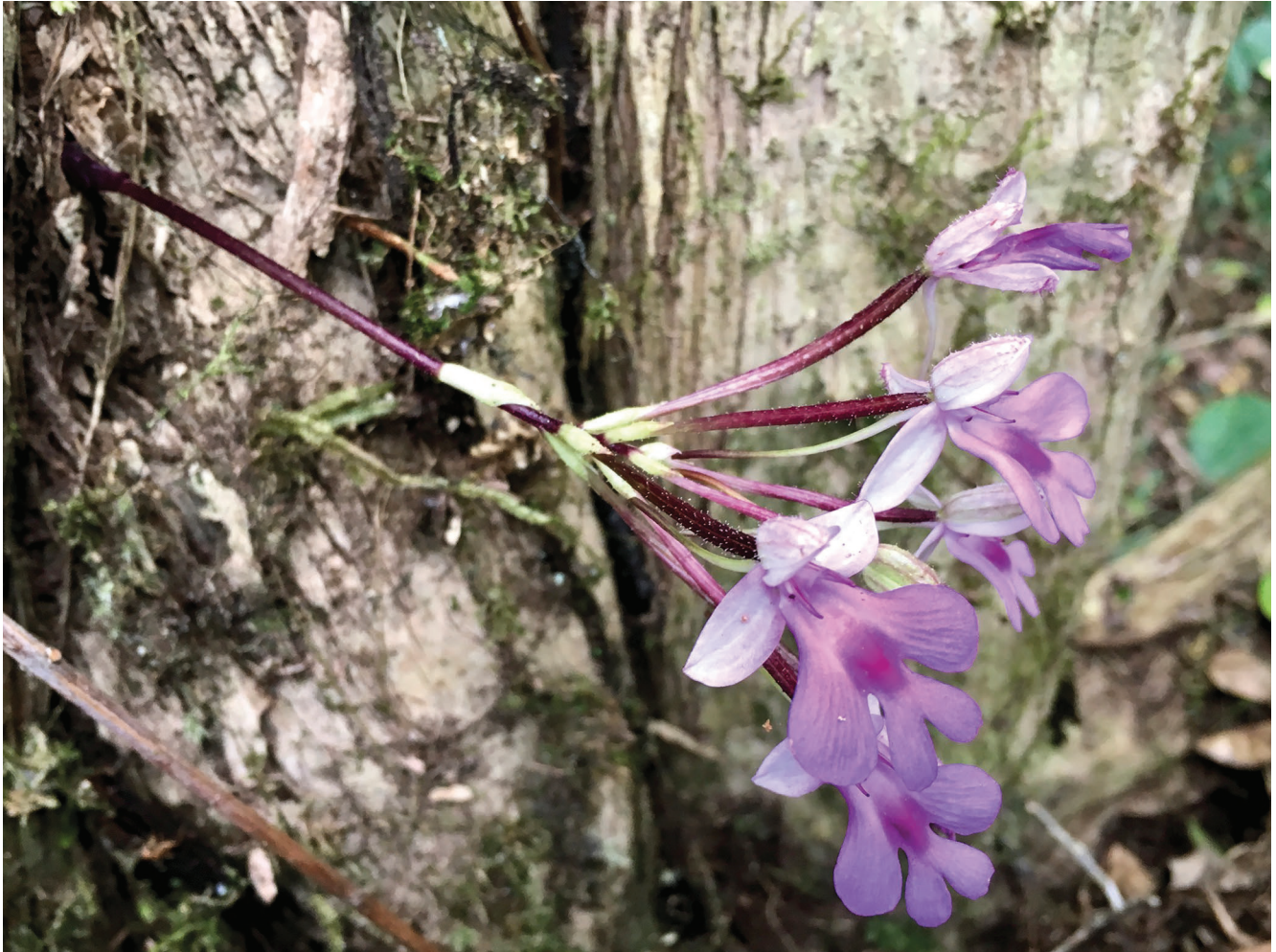
FIG. 3. — Cynorkis benaraensis Vennetier, Traclet & Dimassi, sp. nov., plante entière, 03.IX.2017, crédits photo : E. Vennetier. Le rhizome est inséré à l'intérieur de l'écorce d'un Nuxia pseudodentata Gilg.