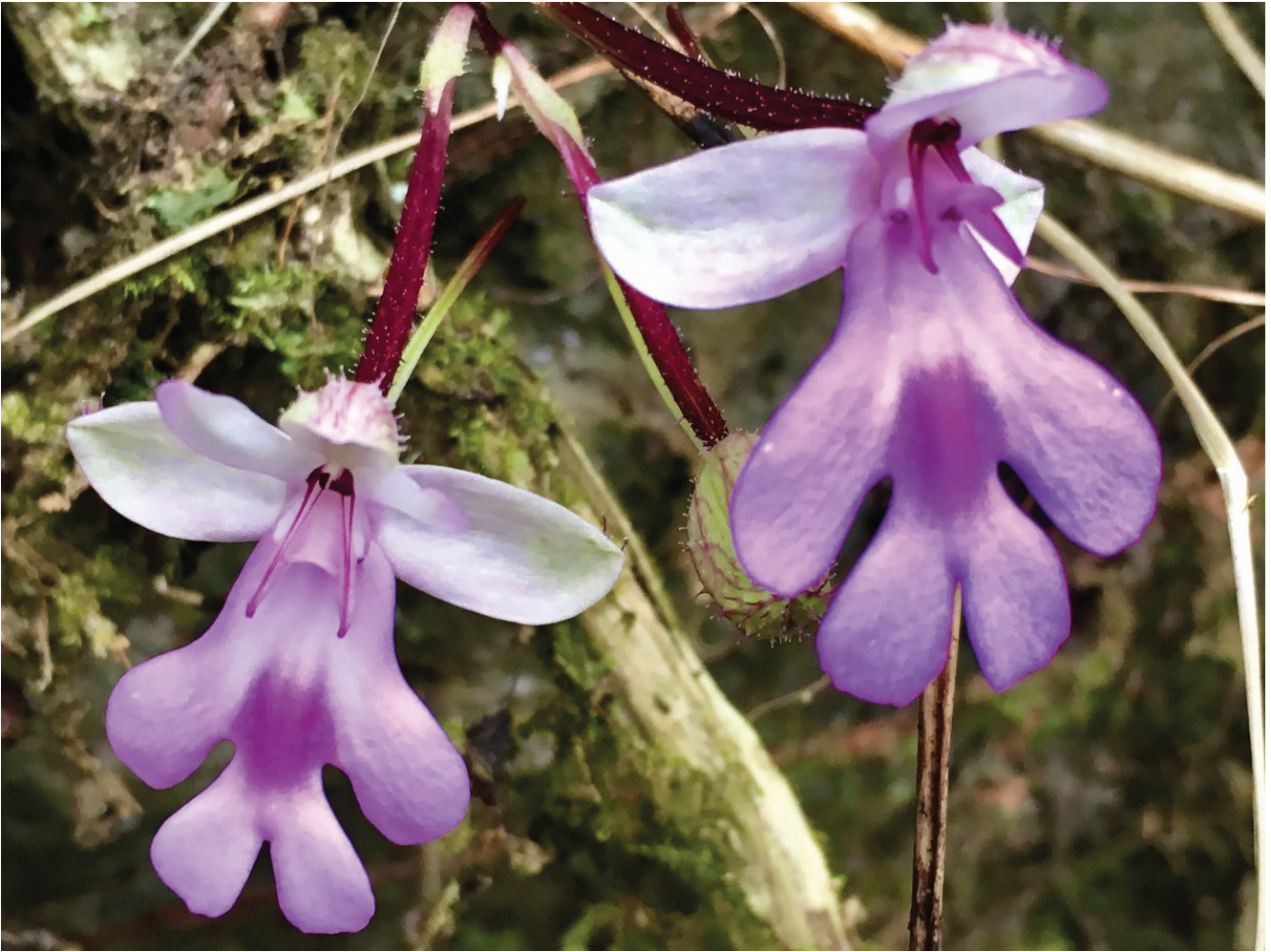
Fig. 2. — Cynorkis benaraensis Vennetier, Traclet & Dimassi, sp. nov., fleur, 03.IX.2017, crédits photo : E. Vennetier.

Fleurs (Fig. 2) 23-27 × 19-25 mm sans l'éperon. Ovaire avec le pédicelle de 38-52 mm de long, 1,9-2,2 mm de large à l'anthèse, glanduleux, concolore à la tige, le pédicelle généralement plus clair. Périanthe blanchâtre teinté de vert ou de rose. Sépales portant dorsalement de nombreux poils glanduleux-hispides jusqu'à 2 mm de haut. Sépale médian très concave, ovale, aigu, 12-13 × 6-8 mm, trinervé. Sépales latéraux, 13-15 × 6-7 mm, concaves, subobovales, arqués, subaigus, trinervés. Pétales 12-14 × 3,5 mm, glabres, elliptiques-falciformes, subobtus à aigus, formant le plus souvent un casque avec le sépale médian mais quelquefois libres, blanc à marge externe teintée de rose, à trois nervures peu distinctes. Labelle 23-27 × 19-25 mm, quadrilobé ou trilobé avec le lobe médian profondément échancré, longitudinalement convexe, rose lilas et présentant en son centre une macule rose foncée. Lobes latéraux plus longs et plus larges que les médians, multinervés, 6-9 mm de large, entiers, oblongs à obovés, arrondis à subtronqués. Lobes médians 5-6 mm de large oblancéolés, à bord distal entier ou légèrement émarginés ou tronqués, ou arrondis. Éperon glabre, légèrement conique à la base puis filiforme, s'atténuant graduellement et quelquefois légèrement renflé vers